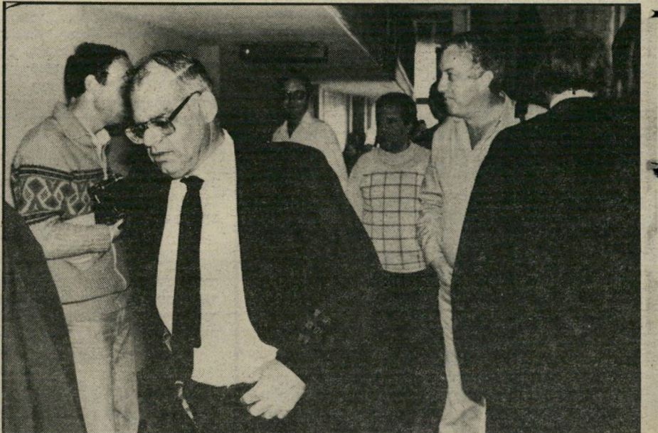
פרקליט-מחוז שר"ר (משמאל) עצר את החקירה