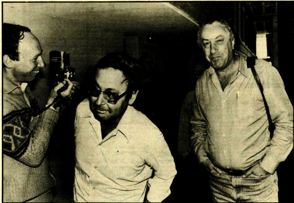
נאשם לביב וקצין מישטרה אישי-שלום* קסטו מפלילה

הכנסה מסויימים, שבהם הוא מעוניין, יסתיימו יותר מהר, והוא יקבל עבורם את שכרו? כתב השופט. בעיקבות הויכוח המרשיע הפסיק לביב את עבודתו בעיתון הארץ. אך הוא התפרסם והחל או בקאריירה עשירה של גילוי פשעים וחשיפת פרשיות. את פרשיות אשר ידלין והשר אברהם עופר חשף לביב ככתב העולם הזה. ברבות הימים החליט לביב כי הגיע הזמן שיהיה לו עיתון פרטי משלו, כדי שלא יהיה כבול לעורכים ועורכי-מישנה. הוא קנה את הירחון חדשות המישטרה, והחליף את שמו למאה. לביב פירסם על שער הירחון מדי חודש דמות של אישיות חשובה אחרת הכרוכה בשערוריה ציבורית שגילה.