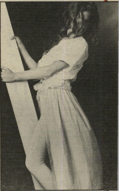
מיכנסי רקדנית הדוקות עם חצי-אית מכווצת. מ' שמאל: שימלת-סטרפלס מבד כפיה, של גלימה.