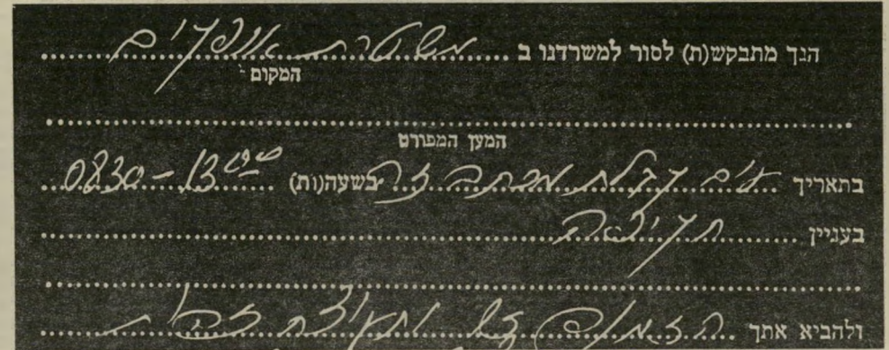
הזמנת מירה לב לחקירה במישטרת אופקים תקיפה או חקירה?

בשעה 8 בבוקר ירדתי מהבית, מצאתי בבית הדין המכתבים הזמנה לבוא