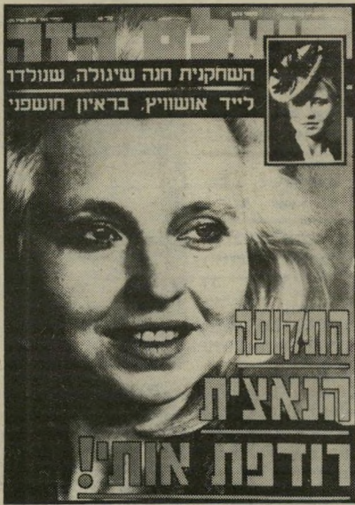
שער "העולם הזה"