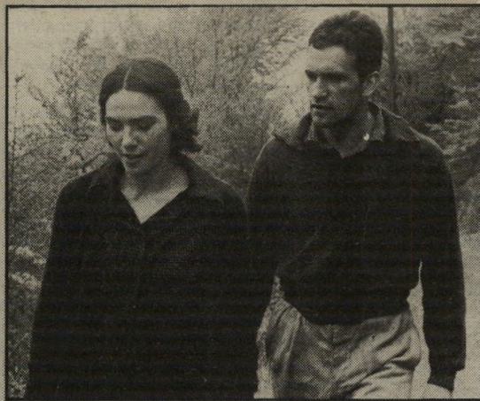
פאצ'י בסקרט ואמאיה לאסה – צניעות ופיוט

לכאורה, מעט מאוד מתרחש בו, למעשה, תשומת-הלב שהוא מעניק לכל פרט ואיזור זה בחיי טאסיו – ממעשי-