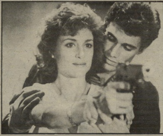
סטיבן באואר ובארברה ויליאמס – קולבים

גונב שוכח עד מהרה את עצמו ומתאהב באמת ובתמים בצעירה הנשואה, היא עצמה אינה יכולה שלא להיטרף אחרי גבר שהוא התגלמות כל מאוהיה המיניים, ובכך בעצם מסתיים כל העניין, בקישוט הזוהי, משתמש הגנב בכסף שצבר בעבודות-הלילה שלו, כדי לרהט דירה ששכר במיוחד לשם כך. מאחר שהגברת היא מעצבת-פנים, יש אפשרות להשתלל בכל מיני צורות וצבעים משוגעים, כאשר בין הצגת רהיטים אחת לשניה, יש סצינות התעלסות לזהות, שבהן, כצפוי, מסתבר שהגנב הוא גם לוליון-מיטה מצטיין.