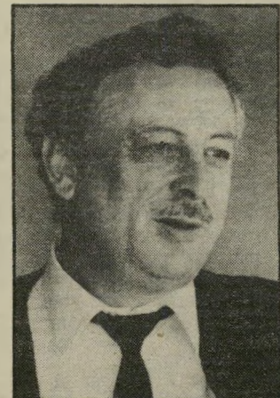
פרקליט מקריין סיוס?