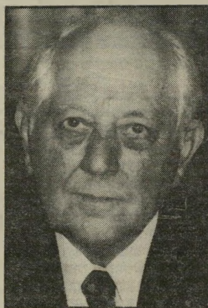
שופט-בריומוס קנת טעות?

השלושה נאשמו בכך שמסרו דירות לאנשים שלא לפי הקריטריונים הקבועים, ובכך מנעו ממישפחות גדולות לזכות בדירות אלה.