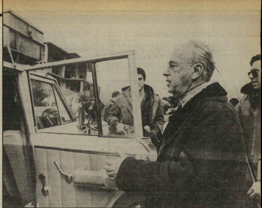
שר-ביטחון רבין בלבנון „בכנות“. במצבו הנוכחי אינו מסוגל לתפקד

במשך שנים ארוכות לא דיברו השניים כיניהם, והתעלמו איש מרעהו גם בנסיבות שחיבו, לכאורה, מגע אנושי כלשהו. אבן הטיל את כל יהבו על מחנה פרס, ותמך באוייבו הוותיק של רבין ככל ליבנו. כידוע, לא זכה אבן לגמול שלו ציפה. באורח טיפוסי מאוד בגר פרס כאבן, והפך את יצחק נבון למועמד המערך לתפקיד שרהחזוץ. בגידתו של פרס כאילו אינה את יחסי אבן-רבין. שרהביטחון אפילו זכה לשבחים מסויימים מאבן, בתחילת דרכו בממשלת האחרות. לאחרונה הוחרפו שוב היחסים בין השניים, על רקע עמדותיו המדיניות והתנהגותו של רבין, משקיפים המקורבים לאבן מסרו, שאבן סבור „בכנות“ כי רבין אינו מסוגל לתפקד כשר-ביטחון במצבו הנוכחי. יש להניח שמקורבו של אבן פירש כך את הדברים, או לפחות כך סבורים אנשי יצחק רבין.