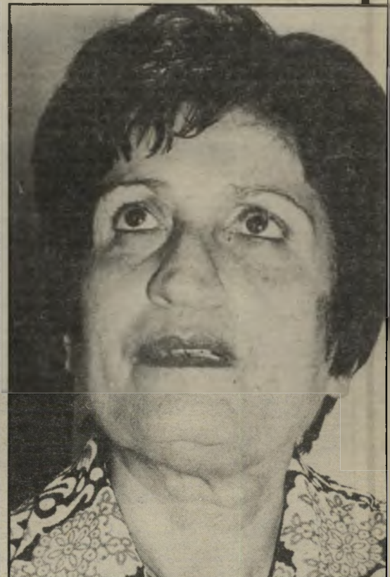
ח"כ ארכלי-אלמוזלינו "נראה את הגיבור יצחק מודעי"