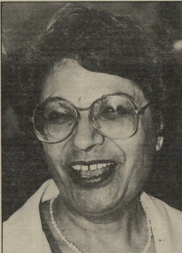
ח"כ תעסה-גילור "יש לי כפפות מאסבסט"