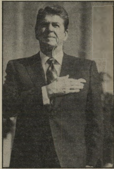
הנשיא רגן הכתובת הראשונה

מי הם אבות היוזמה הזאת? יש רשימה ארוכה — החל ביועציו של