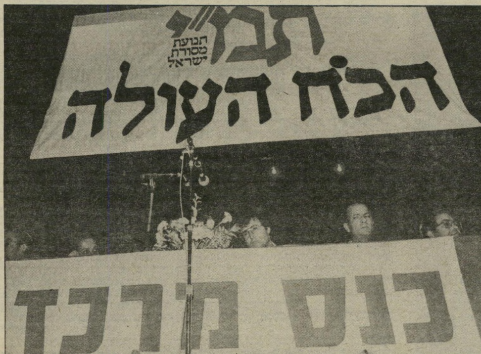
אלי דיין (במרכז) פרש?

השמועות אף יודעות לספר שתמ"י לא תמשיך לשכור את כל קומת-המישרדים העומדת לרשותה כיום, אלא תאלץ להסתפק במישרד אחד, שישי' רת כמוזן את מס' 1 שלה: אה' רון אבוחצירא.