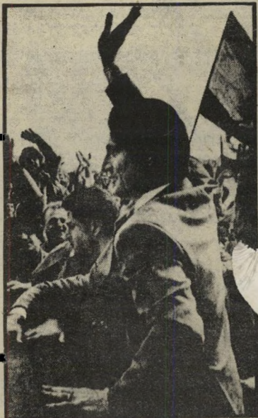
הנשיא ג'מיייל בצידון זעם נאיבי

לרבין סיבה לזעום. אך הזעם הזה היה נאיבי מאוד.