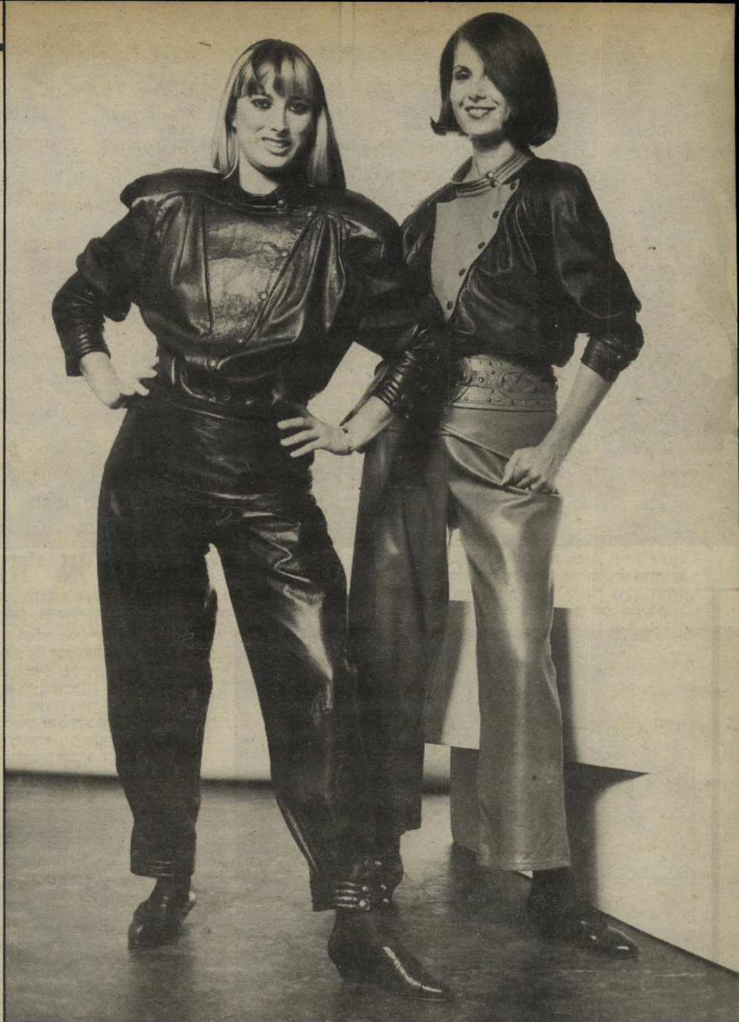
אחר: את חולצת-העור הרחבה, בגוון אפור ושחור, אפשר ללבוש עם מיכנסי-ג'ינס צמודים ואת מיכנסי-העור השחורים אפשר ללבוש עם ז'אקט-סבא מעור.

אם המיכנסיים רחבים, ניתן להצר אותם כהתאם למיבנה הגוף. מיכנסיים ארוכים אפשר להפוך ל-8/7, אם