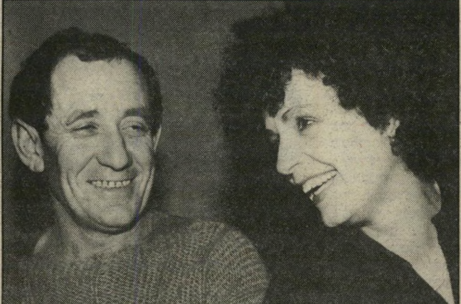
ליאורה ריבלין השחקנית הרחיבה את אופקיה המיני-צועיים והפכה להיות גם זמרת. היא יוצאת לשוק עם תקליט של שירים לילדים, שתורגמו מספרדית, ולכבוד מאור רע זה היא חגגה השבוע בחברת גדליה בסר (לידה בתצלום).