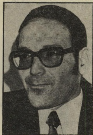
מועמד-לשעבר אדרוטי בלי משכורת מנופחת

אדרי הצליח בחברה, חיסל את הגירעונות, ובניתיים גם עשה חיל בפר ליטיקה. הוא ניהל את המשאומתן הקואליציוני עם יחד ויום את צירוף סיעתו של עזר וייצמן למערך. באותם הימים היו רבים בטוחים ששימעון פרס יגמול לו, וימנה אותו לתפקיד שר בממשלה החדשה. לבסוף נאלץ להסת