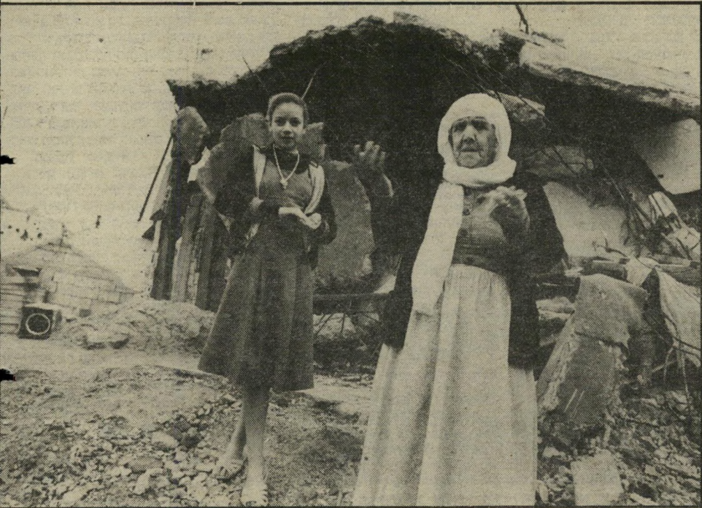
פליטים במחנה עין-אלי-ח'לורה צוברים נשק, מתכוננים לבאות

ההחלטה לקבור את מבצע שלוס-הגליל קבורת-חמור, הגי-עה לא רק את גלגלי מערר-הפינוי של צה"ל, אלא גם את קרי-הצעות הרוחש מתחת לפני השטח בצידון ובסבי-בותיה. גורמי-הכוח השונים מתארננים, צוברים נשק ומתכוננים לכאות. בניגוד לנסיגה מן השוף, הרי במיקרה הנוכחי קשה יותר להעריך את אשר יתרחש לאחר יציאת צה"ל מן האיזור. כאשר נסוג צה"ל מן השוף, הוא הותיר מאחוריו שני מחנות ברורים — נוצרים מול דרוזים — כאשר ברור היה, כי שום כוח לא ייכנס לשטח כדי לתצוץ בנייהם. כעת מתכונן צה"ל לעוזב שטח בעל פסיפס ערדי ופוליטי מורכב ביותר, כאשר לא ברור אם אכן ייכנס צבא לבנון לאיזור, בעוד שגם אם יעשה זאת — יכולתו לשמור שם על הסדר לאורך זמן מוטלת בספק. לכן כראי לבחון, מי הם גורמי-הכוח