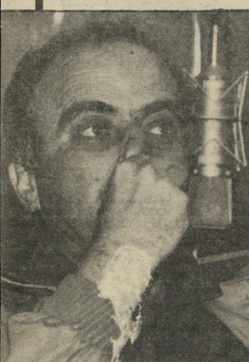
שר-קליטה צור על האמריקאים

השבוע התבררה אמת המרה לעיני כל: לא זה בלבד שההתנחלויות אינן תורמות דבר לביטחון המדינה, ולא זה בלבד שהן מהוות עתה מיכשול לשלום הדרוש לכלכלת המדינה, אלא שיש צורך בהוצאות עצומות כדי להגן על ההתנחלויות עצמן. בשעות הגורליות הראשונות של מלחמת יום-הכיפורים היה צה"ל עסוק בהצלתם ובפנינייהם של המתנחלים ברמת-הגולן. בצורה פחות דרמטית הוכח השבוע שוב, שההתנחלות מחריפה את בעיות הביטחון, תחת לפיתרון, כטענתה. טירוף המערכות. בכנישי הגדה היו מיקרים של יודיאבנים, השלכת בקבוקי-תבערה (שגרמה למות קבלר-פועלים יהודי) ואף מיקרה של (המשד בעמוד 8)