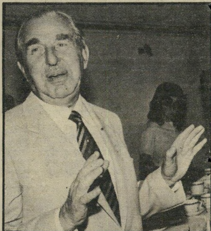
חיים הרצוג לפי הנסיעות

יש לי רק בקשה אחת. אני מצטלמת מאוד לא טוב, ותמיד שמים תמונה איומה שלי, שלי- עומתה אפילו דנקנר נראה יותר טוב ממני, ואו אומרים: תראה את האשה שכותבת ביקורות, וכולם מאמינים: הם האשימו אותי בכל, רק ברצח ארלווורוב עוד לא. כשיאשימו אותי גם בזה, אתן ראיון לעיתונות."