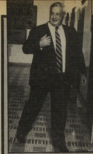
שר שרון לכפות!

וויזיה אשמה ככל, וייתכן שיוזעק כדי לכפות מועמד מוסכם על חברי הוועדה-המנהל ועל המנכ"ל.