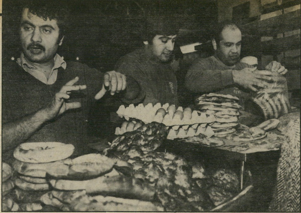
חמים (באמצע) עם אחיו במאפיה "סבא יסד אותה לפני 103 שנים!"

● רק שהם שחצנים וגאווזנים? זה מה שאני יודע. ● אני שמעתי ביטויים כמו "איטבח אל יהודי" מאיפה זה בא אם לא מחינוך? המושג הזה של הכפריים זר לי. אני לא ינקתי מאמא שלי שינאה ליהודים. אבל אני לא רובר של כל האחרים.