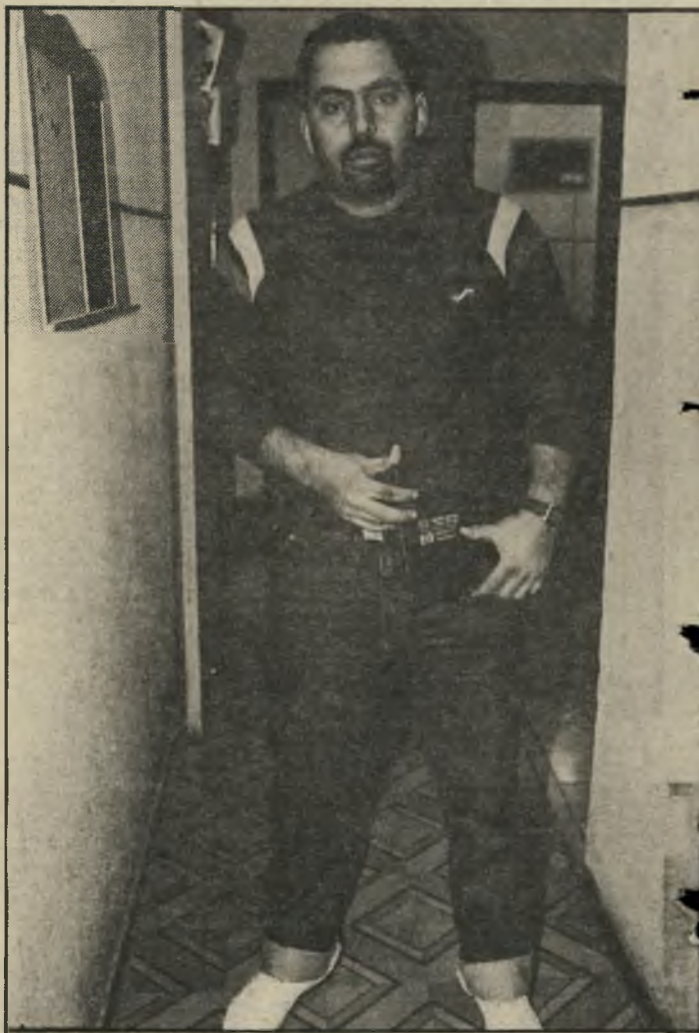
פעיל-לשעבר דאנה כולם חושדים בכולם

ניברסטי-חיפה נרקר עליידי ערבי ומאו הוא שונא ערבים שינאת-מוות. אדיר שונא באותה המידה גם את הש" מאל היהודי. לחברי המישרות הלאומיים ים" יהיה לבוש אחיד. חולצות שחורות, ועליהן אגרוף, הסמל של "בך". כמה מהם כבר התני חילו להתאמן באיגרוף, כי הדרכתו של מאמן-איגרוף בי כיר, שהתנדב למשימה. אחרים מתאמנים בקראטה. רוב החברים נמישרות הם מובטלים, חלקם עריקים מצה"ל, המחזיקים בנשק. המשותף להם הוא שינאה לערי בים. המישרות הלאומיים יוצאו ל-