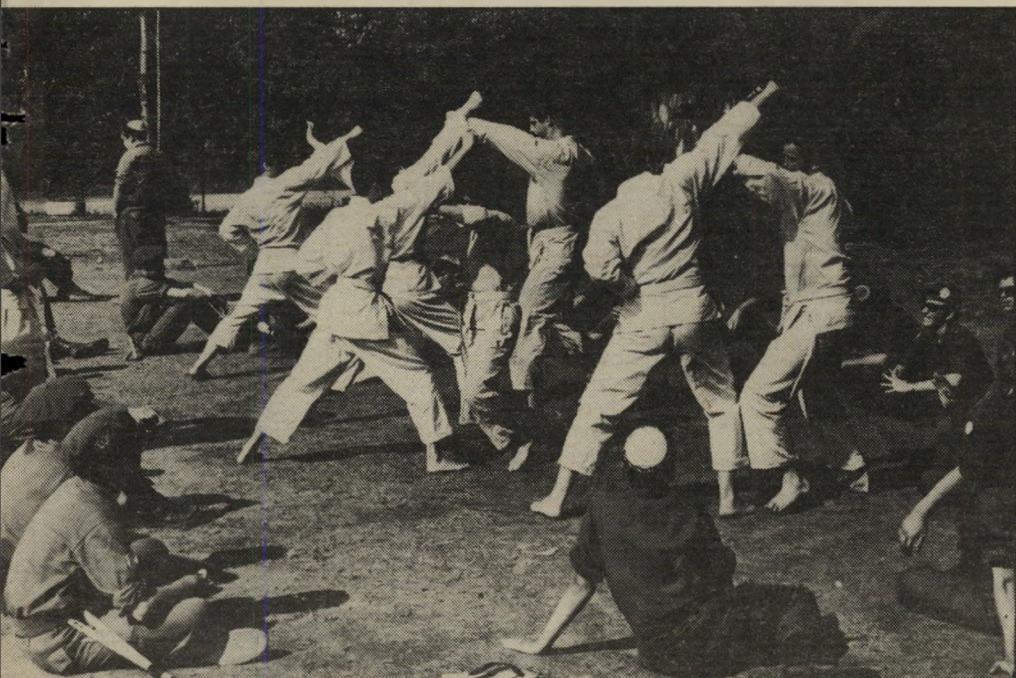
מחנה-אימונים של הליגה-להגנה-יהודית בארצות-הברית עריקים שיש להם נשק

שומר בתחנת המיטרה הזו עירה ככיר אתרים שבתל-אביב כי לא יכול היה להתעלם מהצרחות. זהו מקפיאות רם. הוא מיהר ונטל את נישקו. נטל פנס גדול ופנה אל מקור-הרעש ליד אחד מבתי-הקפה שבסביבה. כחשיכה היה קשה לראות בכירור מה מתרחש. הוא חיפש בעזרת הפנס והבחין, לא הרחק ממנו, בקבוצת צעירי רים הלבושים בשחור. ביניהם היה ש"רוע על הריצפה צעיר. הוא היה מעוות כולו. מיכנסיו היו מופשלים וחולצתו קרועה. "זה נראה כמו אונס קבוצתי", אמר השומר לעצמו. אלא שריח חריף, לא מוכר, הפריע לו. אחד הצעירים שחש כאלומת-האור המכוונת אליו, הסתובב ופתר ללובש המדים את כל הקושיות. הצעיר לבש חולצה שחורה, ובמרכזה היה מוטבע סמל מוכר של תנועת כ.כ. — אגרוף קפוף על רקע צהוב. השומר נזכר בתידרוך שקיבל במר"ח. אלה הם המישמרות הלאומיים של כהנא. חשב, ואיש לא התייחס אליהם ברצינות! הצעירים עמדו לרגע, שרו בקול רם