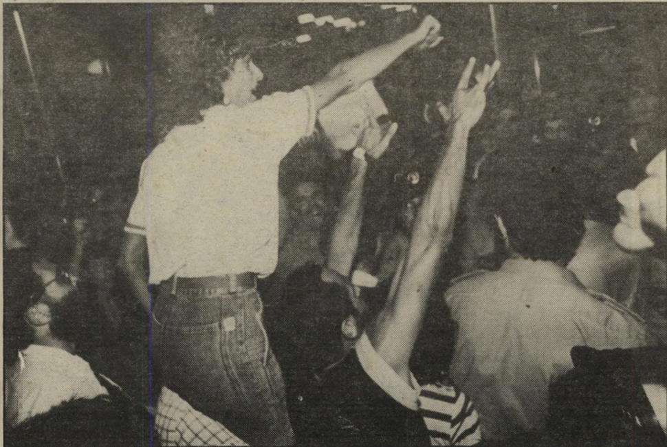
ראשי-סניף מזל בהסגנה נגד הסרט "מאחורי הסורגים" כל הפעילים הפכו למובטלים