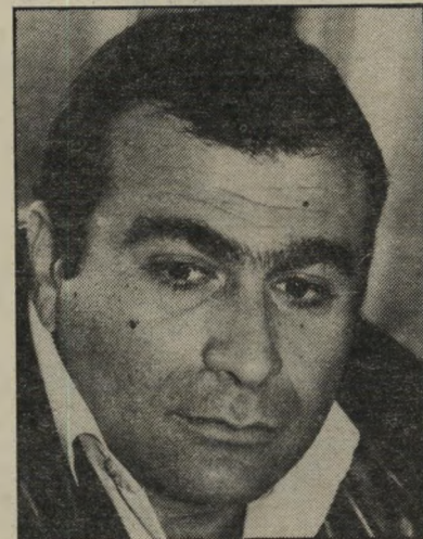
חבר-מליאה מנע הנמיק את הטון

לשונות רעות הלעיטו בשבוע שעבר את ה- עיתונות בידיעה המרעישה שלטוביה סער,