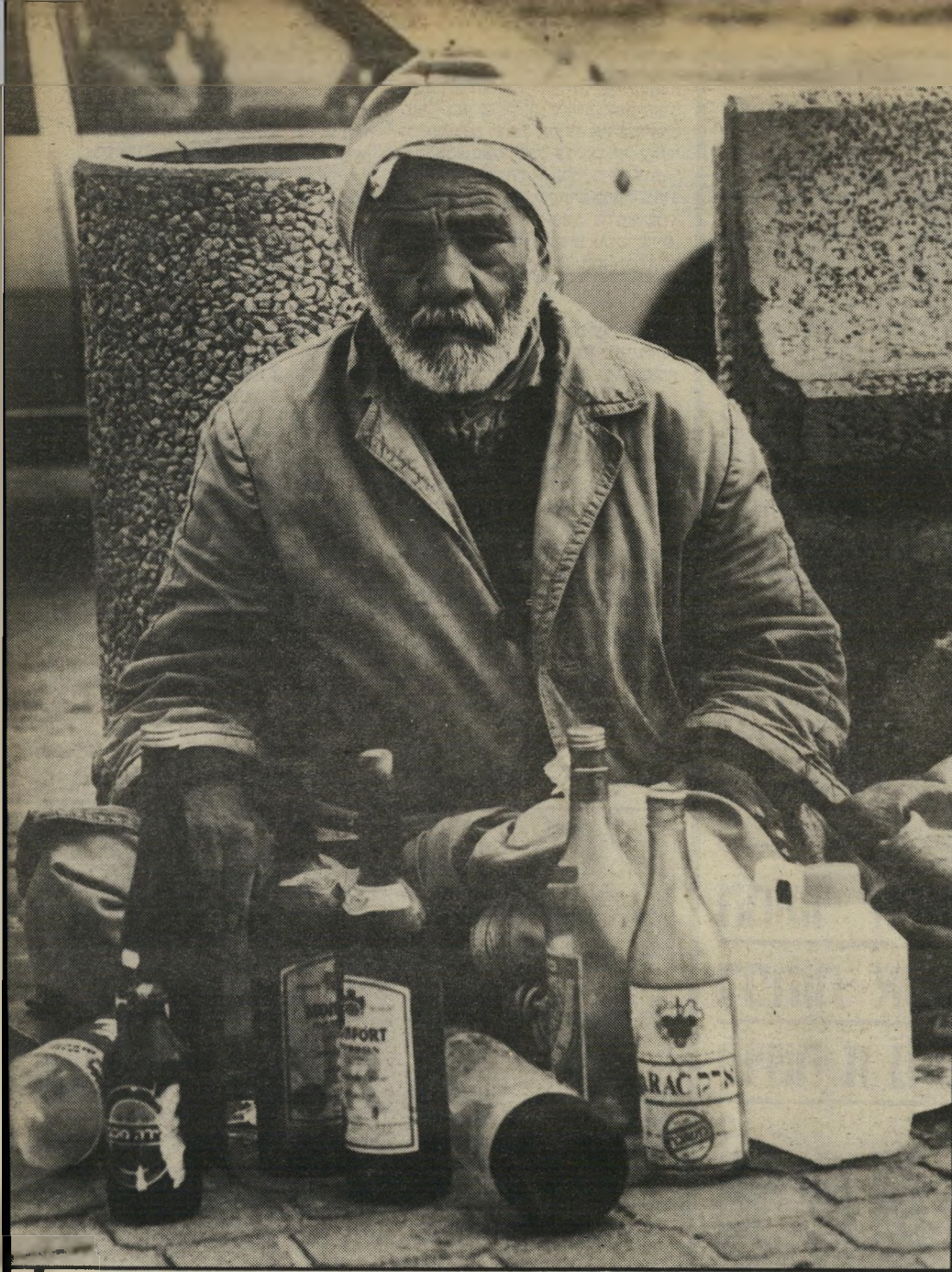
מוכר הבקבוקים למילוי, בעזרת השם, יהיה טוב!

היא טוענת שהיא לקחה על הבית בבבלי הלוואה ושהוא היה ערב להל' וואה. את יודעת באיזה תיחכום הוציאה ממנו שטרר'ערבות? אני יודע. אני ניהל' עושה".