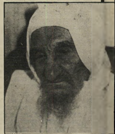
ישראל אברהבצירא 93 יום ו-93 שנים