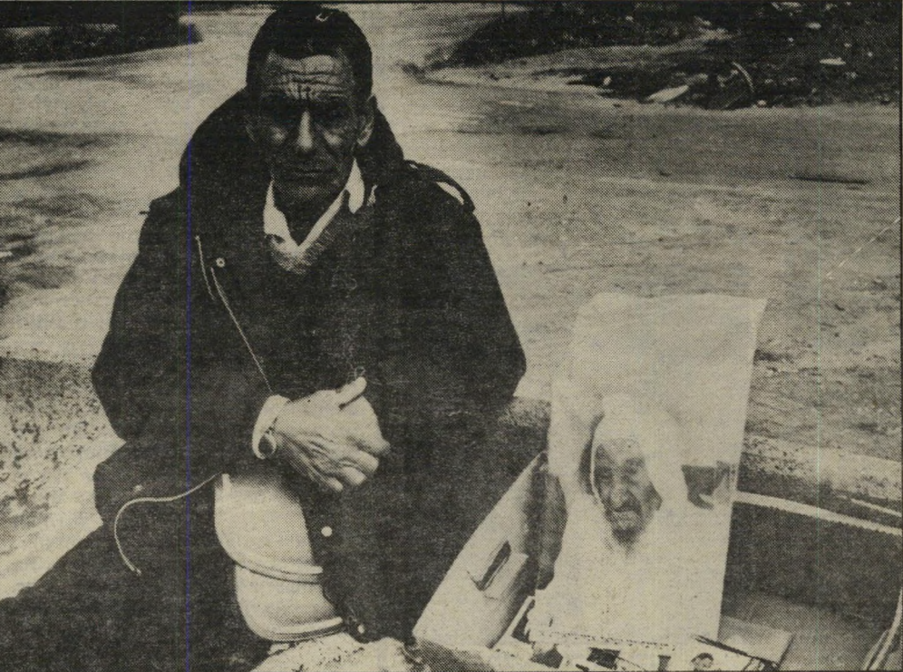
מוכר תמונות הקדושים לשלם על כל צעד ושעל