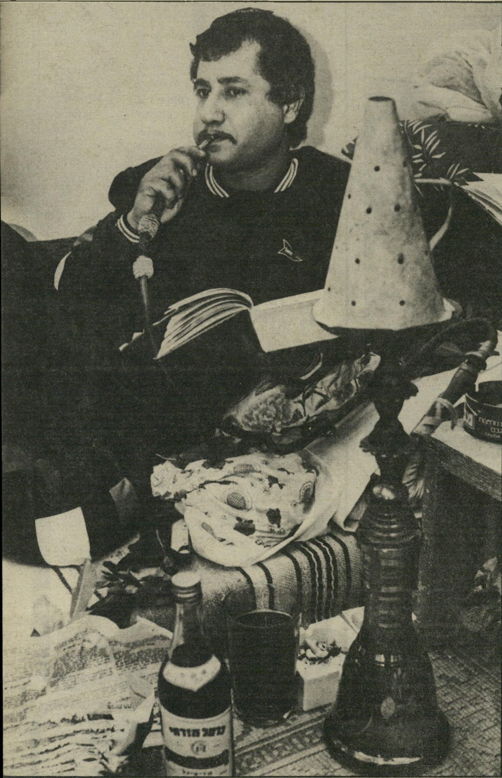
עלים הכיר בחורה. סיפר שמעון, היא נראתה לו מאוד יפהפיה. למחרת, כשראה אותה בלי ההשפעה של הגת, הוא נבהל. היא היתה מכווערת ובלי שיניים.

אלה חברה טובים, ישרים, אנשי־מישפחה מסורים. הטוהר שלהם הקסים אותי. זו לא אורגניתי סמים. היו נרקומנים ששמחו לגלות שיש סם חוקי, אבל הם לא עומרים (המשך בעמוד 24)