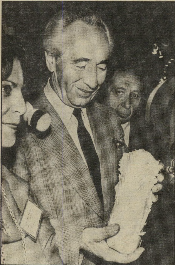
שיגעון פרס התמנה השבוע מעיסקי חבילה ב' ובא למלון הילטון בתל-אביב, כדי לצפות בתערוכה לקניינים בלבד של שבוע המאון הישראלי. פרס גילה עניין מיוחד בפירות ובירקות הטריים והעסיסיים שהוצגו במקום. נטל לידיו כרוב סיני שגדל בארץ וביקש עליו הסבר מפורט ממלוויו.