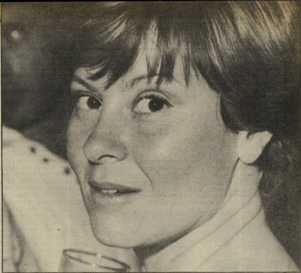
אביה פשושדו ז"ל שנינו התגרשנו האחד למען השני

בחיים. רפי הציע שאקנה את חלקו בשותפות במועדון סוף העולם. אני, משום מה, אמרתי — כן. אחריכך, כשהתפכחנו, ורפי הזכיר לי את העניין, לא האמנתי שהכנסתי את עצמי לדבר הזה. אני, סרן בצבא, מאיפה היה לי כסף לקנות? מה לי ול מועדון לילה? אבל מכיוון שהבטחתי — ואני תמיד מקיים הסכמים והבטחות, גם כשהם ניתנים בעל-פה — עזבתי את הצבא, שבו היתה לי קאריירה גדולה, ונכנסתי לשותפות במועדון הלילה.