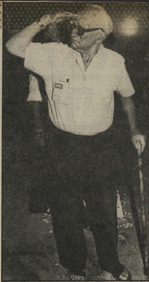
אחד התצלומים האחרונים של בנטוב