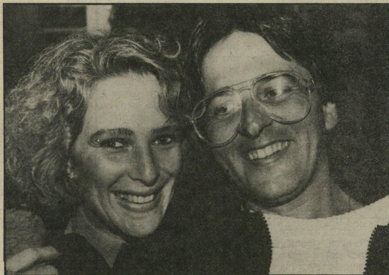
דוקי וחוצ'ו לנגנס עד מאחורי האוזניים

מכאן תבינו כמה אמיצות היו צריכות להיות אותן דוגמניות שהביאו לי את הסיפור על 'שולה סוגל'. מנהלת סוכנות-הדוגמניות גרבו. למען האמת, הסיפור הזה כמעט עלה לי ביוקר רב. למזלי אני לא עצלנית. שימעו על שיחה מעניינת