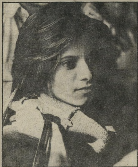
חיילת באולם. הוא זקן ולא חתיך"