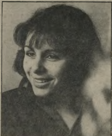
חיילת באולם. הוא חתיך"