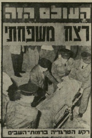
העולם הזה 1164, התאריך: 13.1.1960