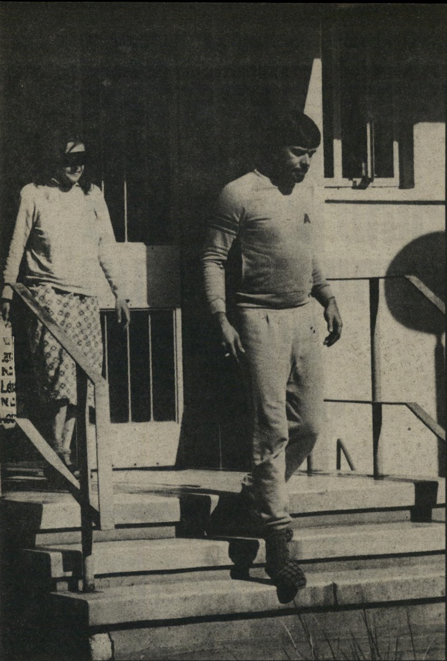
הרסו יוצא מהביתן לטיול בחצר אני במחלקה הסגורה על-פי בקשתנו!

אז כשביל לא לצאת מדעתי הקהיתי את חושי. כן, ככה זה, באמת, קרה. ● קודם לא שתית? שתיתי כמו כולם, מה. ● אני זוכרת אצלך תקופות של שכרות ואלימות, עזר לפני 1981. זה דבר שמלווה אותי כל החיים, ההסתבך