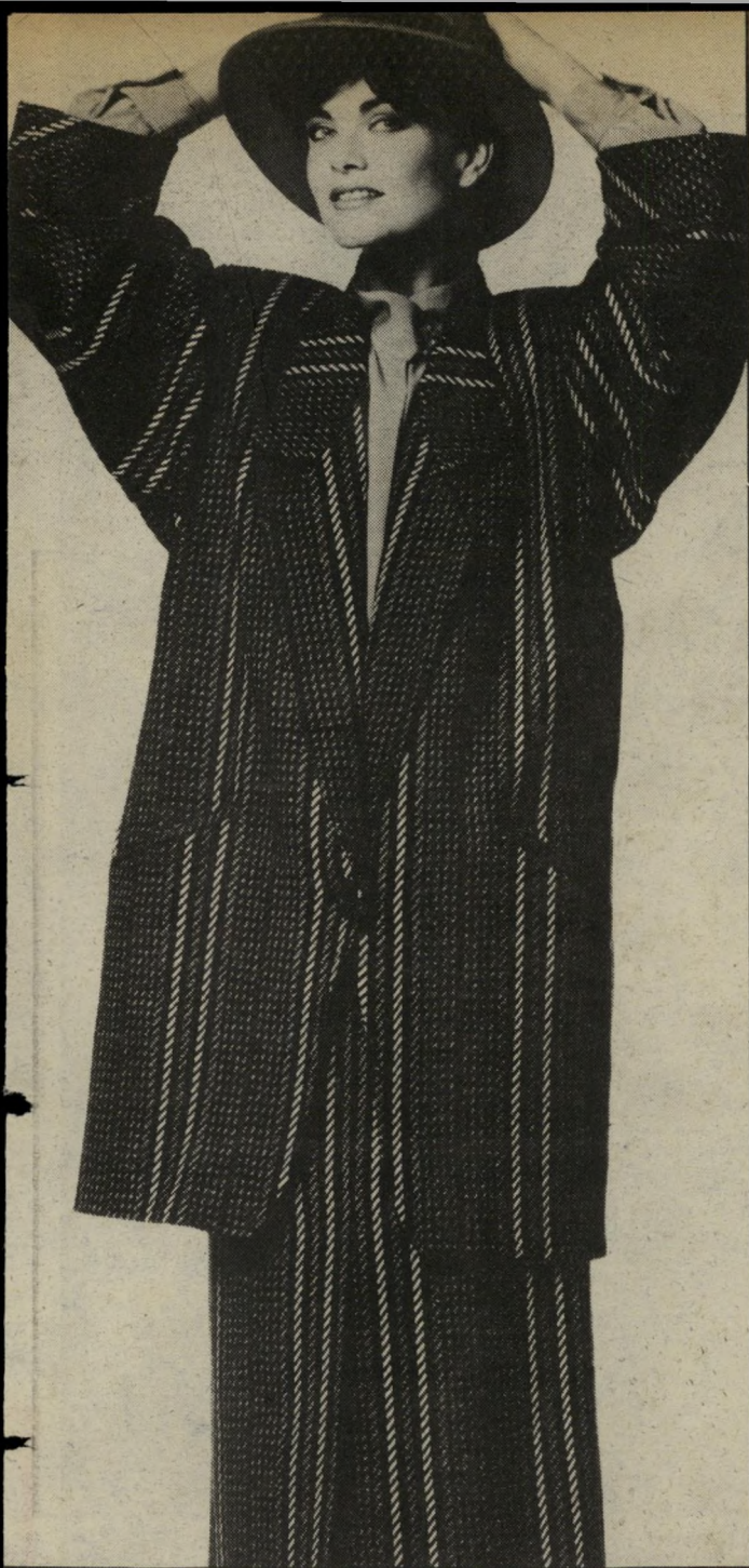
1985 חליפה, בעיצובה של יהודית גוטפריד (גוטקס), מבד צמר ממוספס, בגווני שחור-לבן-אפור; הז'קט, במראה הסבא - ישר ורחב; השרוולים - עטלפיים והמנז' רחב; החצאית - באורך מידי.