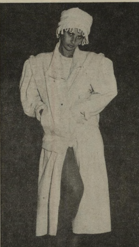
זרק חליפת-צמר בגוון השמנת, בעיצובה של רחל ברזין מביבה. ז'קט גדול ורחב; חצאית חושפנית. מראה צעיר, עבור בנות-הנעורים.