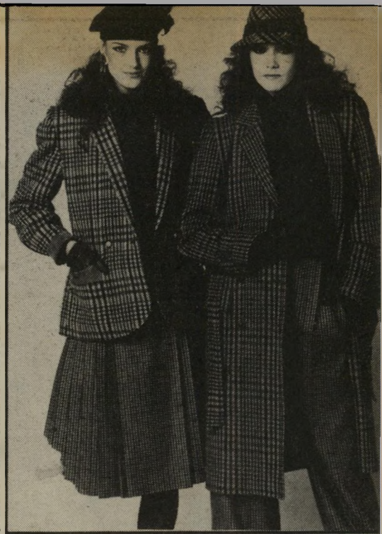
1983 חליפת ז'אן-לואי שרר, מצמר משובץ, אופנתית גם לחורף '85 - ז'קט בלייזר; חצאית-קמלים; מעיל ארוך ומכנסי-פאנסים.