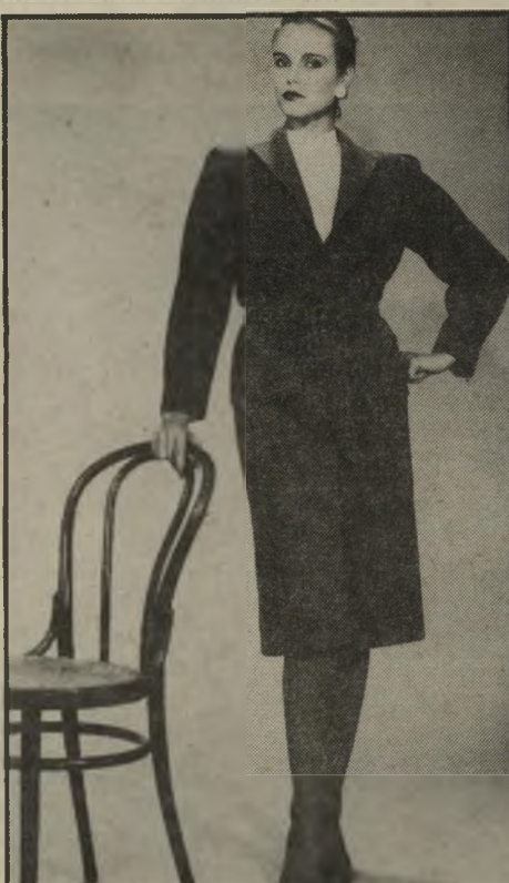
שמרני מראה מחוייט של בגיר לאשה שאינה מחפשת תמיד את שגעונות האופנה. מראה קלאסי ותמיד לבושים בו היטב.

תיק קטן וכובע כלשהו, שיוסיף נופך להופעה. החליפה היא אחד מפריטי הלבוש שליחם אינו נס ברבות השנים; גם חליפה ותיקה, בת ארבע או חמש שנים, קוצרת מהמאות. כי חליפות אינן חול-פות, בפרט מי שרכשה חליפה טובה, מבד איכותי, בסגנון קלאסי-אלגנטי. מי שהתמזל מולה, וקנתה, לפני שנתיים-שלוש, חליפת מיכנס או חצאית באירופה, יכולה ללבוש אותה ולהרגיש כאילו יצאה מירחון-אופנה. לדוגמה, חליפה בעיצובו של המעצב