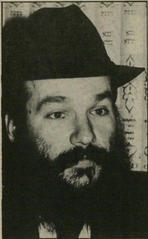
הרב יוסף הכט: