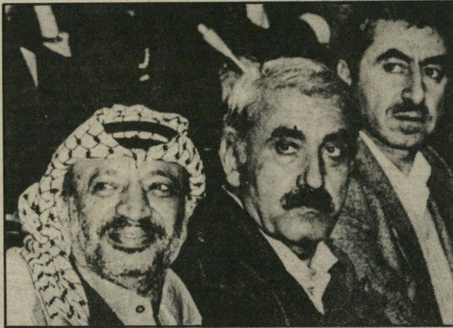
מחרימים הוותמה וחבש עם ערפאת (1981) מקומות פנויים