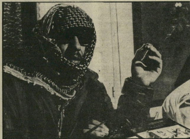
מגורש גיבריל אש על אחים פלסטיניים

● האמד אברסיטה, בלתי-תלוי. הרכב הוועדה-הפועל מעניק עתה אפשרות מלאה להגנת אש"ף לעלות על דרך ההסדר המדיני. הוא מאפשר לאירגון לפעול בשיתוף-פעולה עם ירדן, ולחתור להכרה הרדית בין אש"ף צירופם של כל אלה בא על חשבון