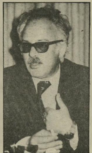
נרצח קואסמה 70 אלף בוחרים

ואלה הם: ● החזית העממית לשיחרור פלסטין, בהנהגת ג'ורג' חבש, כור