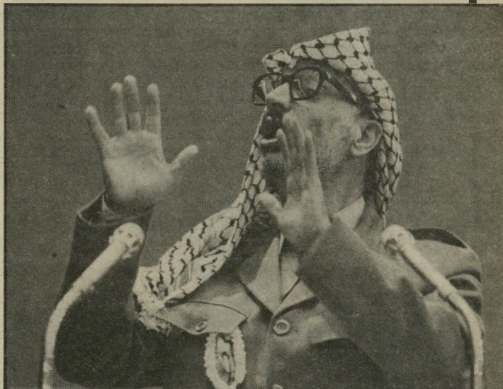
יורד ערפאת רוב מוחץ

כפי שמגלה השבועון ישראל אנד פלסטין, המופיע בפאריס בעריכת מקסים גילן, היה קואסמה אחד הרופאים העיקריים למעשה המהפכני,