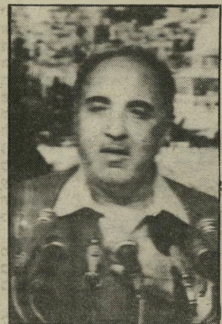
אבריאד בלי דגש צבאי

האירגון של אחמד ג'יבריל , החזית העממית - המיפקדה הכללית - שהיה מייצג בוועד הפועל של אש"ף על-ידי טאלאל נאג'י , גורש מאש"ף רשמית, על-ידי הצבעה כללית ברובידעות כמועצה. האישום: אנשי ג'יבריל השתתפו בפועל בהתקפה הסורית על הכוחות הפלסטיניים בטריפול