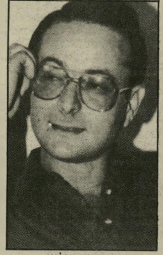
סגנישר מילוא דחייה בכל מחיר