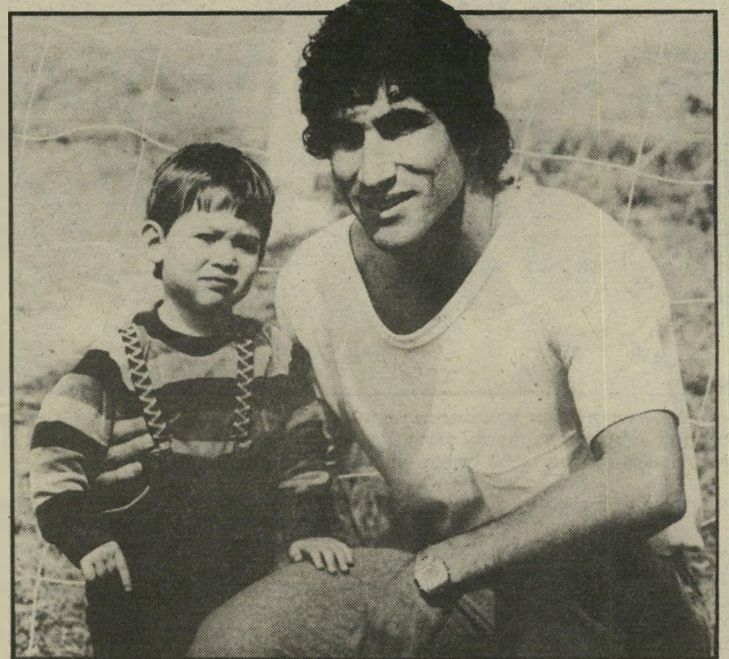
לביא וכפיר בכוא העת. יורש לאב

ל ביא נשוי לצביה ואב לכפיר (3) וסוהר (2) ומאמין שאחד מכניו יהיה גם יורשו. בכוא העת, לביא הוא בעל חנות לחומרי-בניין בנתניה. בשותפות עם גיסו.