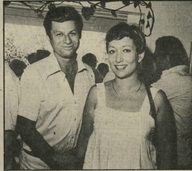
היבנים מה משדרים?

שעזב רן שילון את ניהול מחלקת החדשות בטלוויזיה, קיבל חיים יבין את התפקיד במקומו. יבין, הנמצא גם הוא בטלוויזיה מיום הקמתה, צמח ופרח במחלקת החדשות. הוא ידוע כאדם סימפטי ביותר, ובזאת מודים גם יריביו למאבק על המישרה, והתכונה הכוללת אצלו היא יושרו האישי. יבין אדם שנוה