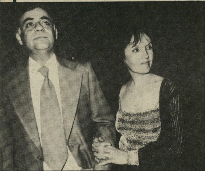
הצמחים למי משדרים?

החדשות, ישימו עליה את הדגש ואולי יזיחו בגלל זה את מחלקת התוכניות.