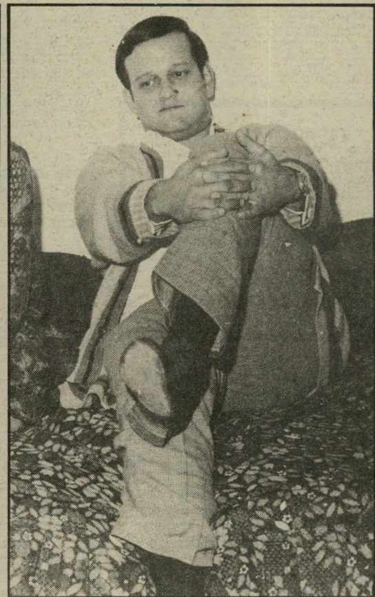
מועמד שילון כישרים מקצועיים, פגישות צפופות