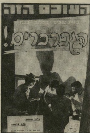
העולם הזה, 1163 התאריך: 6.1.1960