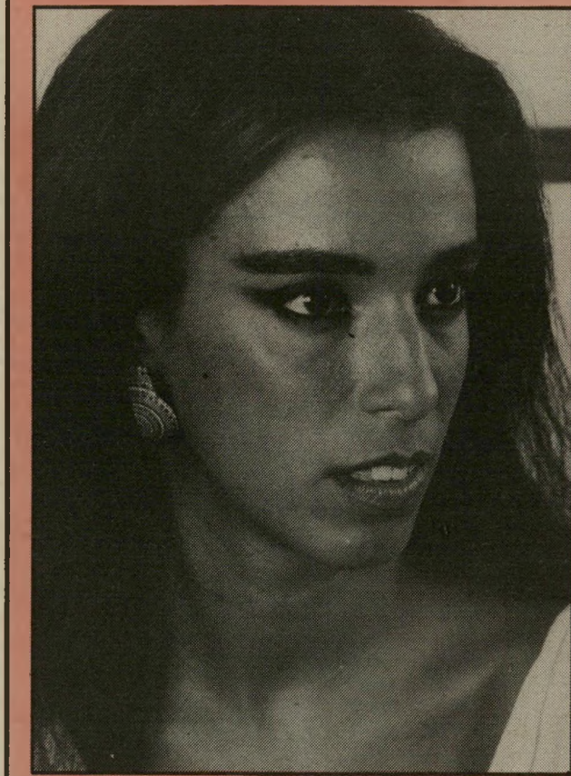
ורד הררי לא זאב בודד