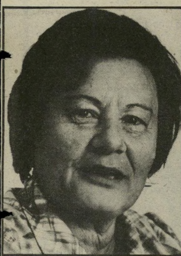
שופטת בן-סוררת טעם לפגם