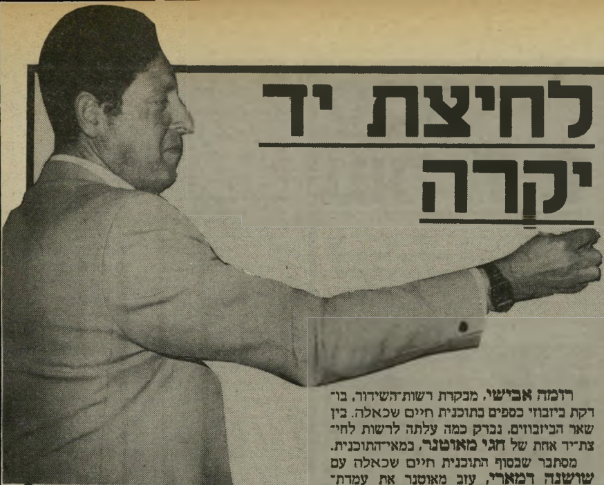
במאוי מאוטנר יד ושם

של דמארי. מבקרת־הרשות בודקת אם המאמץ הזה באמת לקח שעותיים יקרות של עריכה. למרבה האירוניה לא הצליח מאוטנר במשימתו, ושמו לא מופיע בעת לחיצת־היד.