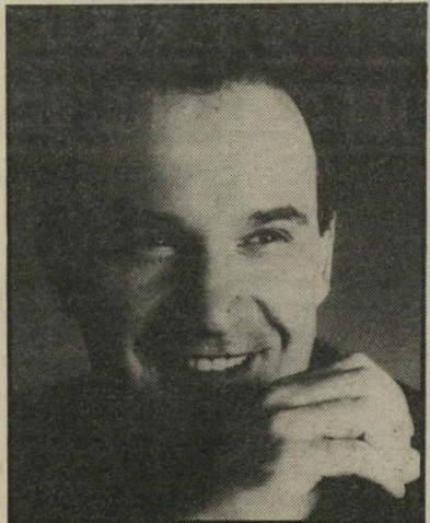
מלחין ג'ורג'ו מורודר עוד להיט

"אירגנתי חמש הקרנות פרטיות של הסרט האילם לפני קהל, בלוויית שאלונים. רוב הקהל ביקש ללוות את הסרט במוסיקת רוק. בעצמי