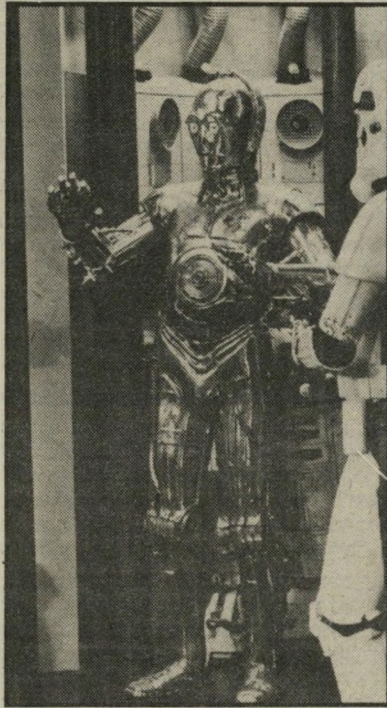
הרובוט ב.מילחמת-הכוכבים החיקוי בשנות ה-80

אחרי שפראנסיס פורד קופולה גילה מה רש את נפוליאון האילם של אבל גאנס (בקרוב בישראל) והפך אותו לאירוע קולנועי מוסיקאלי לשנות ה-80, החליט המלחין ג'ורג'ו מורודר, גאון תורן ומחונן (אוסקר על אכספרס של חצות, ופסיקול לגיגולו אמריקאי, פני