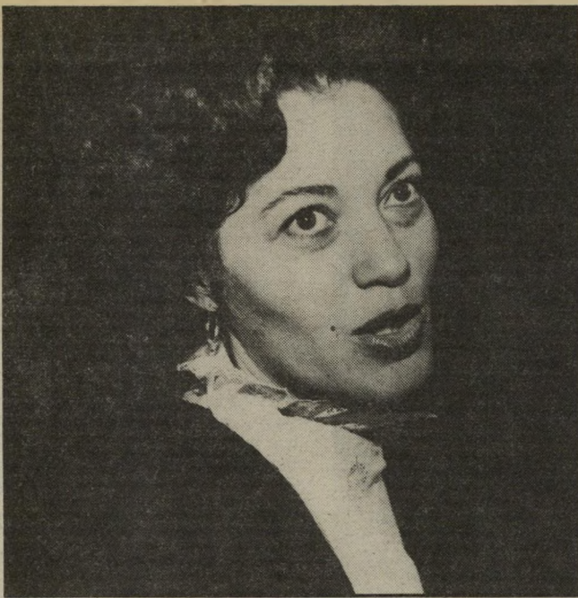
תובעת גיא זרוע אחת לא ידעה על השניה