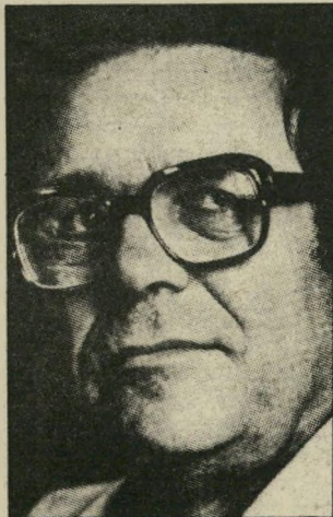
נגיד-לשעבר גסני בנק ישראל

אם לא היה נמנע משום עבירה אילו נעשה כנגד יחיד - דינו מאסר עד שלוש שנים.