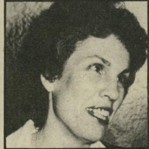
מפקחת-על-הבנקים מאור בנק ישראל