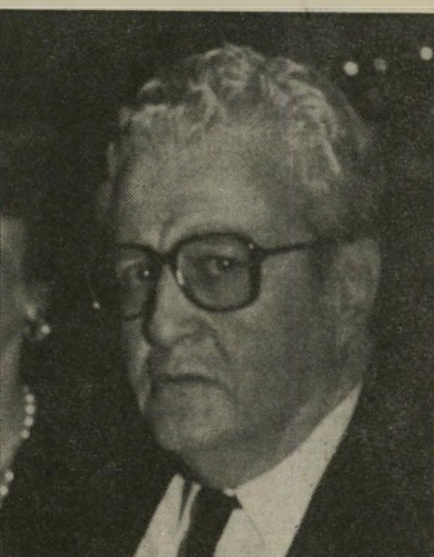
יו"ר יפת בנק לאומי

עיסקייהבנק בדרך שפגעה בי ניהול התקין של עסקיו, צפוי לשנת מאסר.