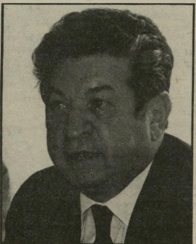
יו"ר גזית בנק הפועלים