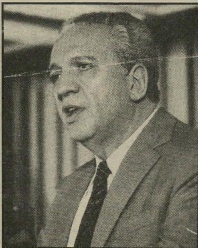
יו"ר רקנאטי בנק דיסקונט