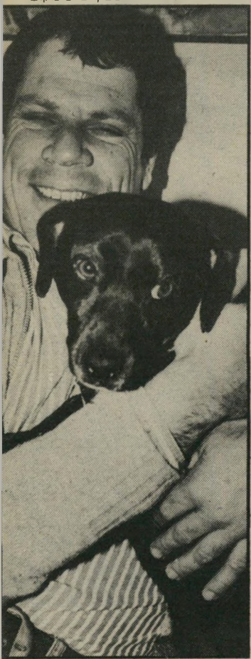
חובבי-חיות הנגבי ממש לא ייאומן -

היא חזרה ביתר-ישאת לזנות. מישום שהכסף היה הרב החשוב בעיניה. אף פעם לא הרגישה צורך להתנצל ולהסביר את מעשיה. העובדה שעסקה